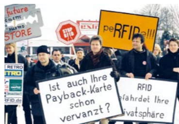
Die Datenschutzorganisation „Foebud“ wird von der Stiftung bridge unterstützt. Februar 2005 Demonstration gegen RFID-Schnüffelchips.

Stiftung Bridge Artilleriestr. 6 | 27283 Verden Tel. 04231-957 540 | Fax 04231-957 541 info@stiftung-bridge.de | www.stiftung-bridge.de