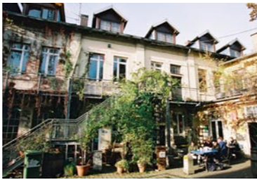
Das Wohnprojekt Grether West hat ein Darlehen in Höhe von 75.000 Euro erhalten.

Dieser verantwortliche Umgang mit dem Stiftungskapital unterscheidet die Bewegungsstiftung von vielen anderen Stiftungen, die mit Renditen aus fragwürdigen Geschäften »Gutes« tun. Gleichzeitig hat die sichere Anlage des Stiftungskapitals hohe Priorität. Ein kompetent besetzter Anlageausschuss berät den Stiftungsrat bei allen Entscheidungen. Auf unserer Webseite können Sie unser aktuelles Portfolio sowie die Anlagerichtlinien nachlesen.