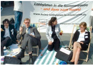
Aktivisten von LobbyControl protestieren gegen Lobbyisten in den Ministerien in Berlin.

Doch die Bewegungsstiftung stellt nicht nur finanzielle Mittel für langfristig angelegte Kampagnen bereit: Sie stärkt soziale Bewegungen auch als strategischer Partner, indem sie sie vernetzt, begleitet und berät. Seit ihrer Gründung hat sie über 40 Kampagnen und Organisationen mit rund 500.000 Euro unterstützt. Aus Erträgen des Stiftungskapitals und Spenden in den Zuschusstopf stehen jährlich rund 100.000 Euro zur Verfügung.