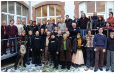
Auf der Strategiewerkstatt kommen StifterInnen und Projekte für Diskussion und Austausch zusammen.

Bisher haben 82 StifterInnen gut 3,6 Millionen Euro Stiftungskapital eingebracht. Das ist ein großer Erfolg, auf den wir stolz sind. Da wir aber weit mehr Anfragen erhalten als wir Kampagnen unterstützen können, möchten wir das Stiftungsvermögen weiter erhöhen. Diese Herausforderung können wir jedoch nur mit Hilfe weiterer ZustifterInnen meistern. Zustiftungen sind ab 5.000 Euro möglich.