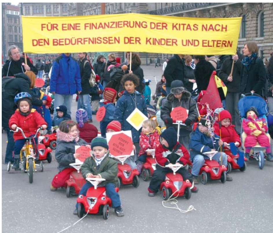
Elterninitiative demonstriert auf dem Hamburger Rathausmarkt

Kampagne Kita Card abgelehnt erfolgreich. Hamburger CDU-Senat einigt sich mit den Initiatoren des Volksentscheides auf einen Kompromiss.