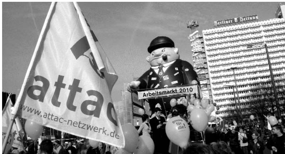
Demonstration gegen Sozialabbau am 03. April in Berlin