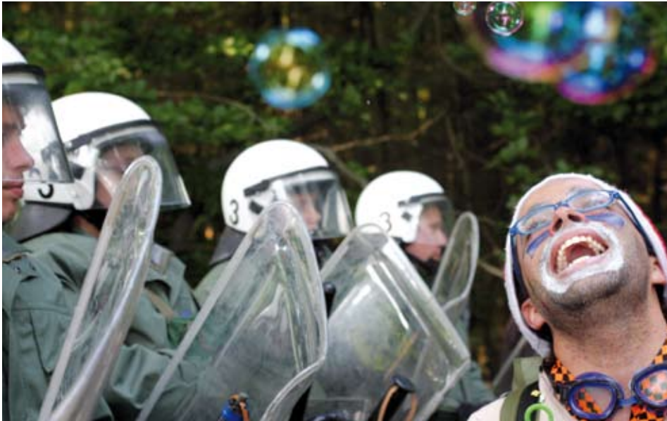
Ziviler Ungehorsam und Protest können die Gesellschaft verändern – und manchmal auch einfach Spaß machen, wie hier bei der Blockade des G8-Gipfels 2007.